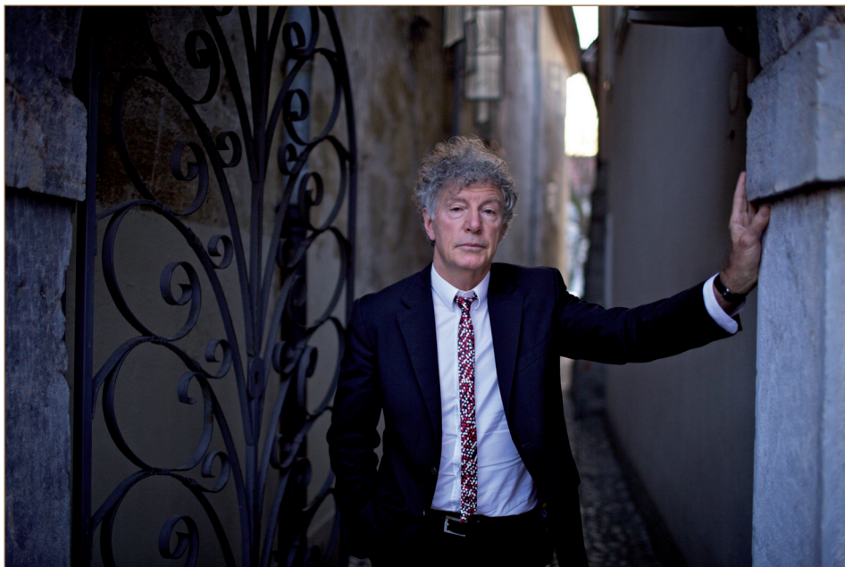
Ljubljana 2010

μοκρατία η διολίσθηση προς μίαν αλαζονική, υπεροπτική και «επεκτατική» εκδοχή της, προτείνοντας μάλιστα ως αντίδοτο την έμφαση στη «σεμνότητα και την ταπεινότητα» που πρέπει να χαρακτηρίζει μια τόσο σημαντική κατάκτηση του ανθρώπινου πολιτισμού όπως η δημοκρατία.